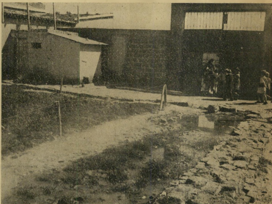
בבית הספר הכללי לומדים למעלה ממאה ילדים. לבית השמוש האחד אי אפשר להכנס, כי הזוהמה עוברת כל גבול. מי השופכים עומדים בכל החצר. פקדי משרד הבריאות בקרו כבר במקום, אך הכל נשאר והילדים משחקים בין זרמי מי השופכים.