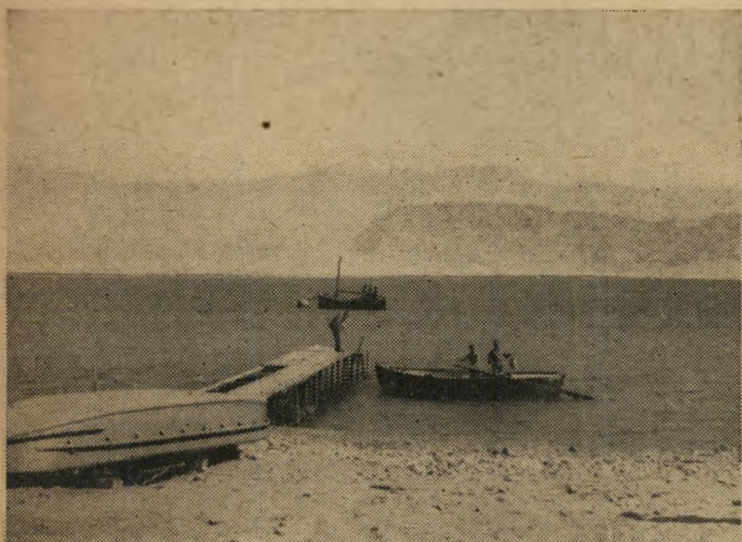
שנה אחת בלבד עברה מאז מבצע "עוכרה", וכבר נבנה המיזח.