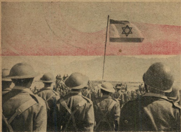
הרגל מונף במסקר צבאי באילת, ביום השנה לשחרורה.