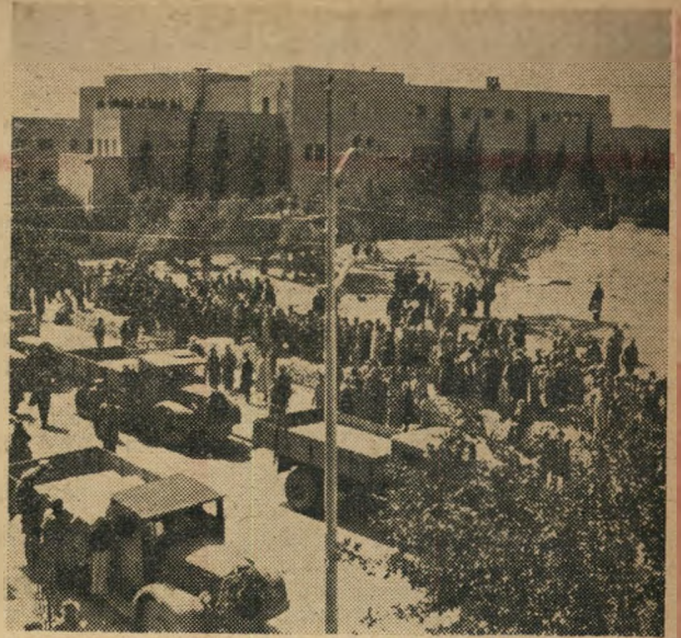
ההלוויה עוברת על פני בניני המוסדות בירושלים.