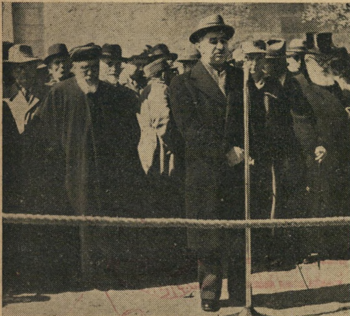
רב יוסף, שר האספקה והקיצוב, מספיד את החללים בנוכחות הרבנים הראשיים - הרב יצחק הלוי הרצוג והרב בן ציון חי עזריאל.