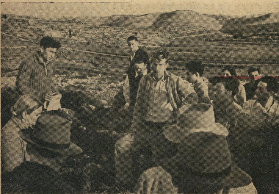
חברי קיבוץ צובא מעלים את זכר החברים שנפלו.