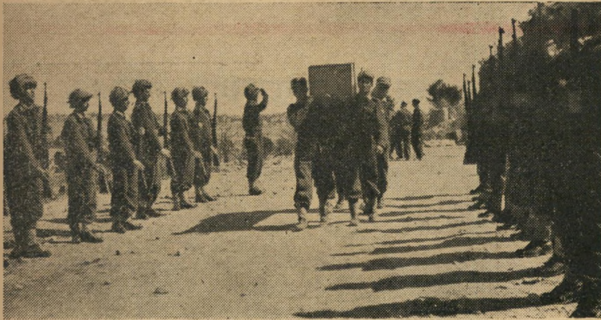
הארונות נישאים על ידי חברי הנופלים.

ימי המצור בירושלים נראים כה רחוקים, ואף על פי כן כה קרובים. בשבוע שעבר הובלו למנוחת עולמים ב"הר הרצל" 115 מחללי הפורצים. שהקריבו את חייהם למען בירת הנצח.