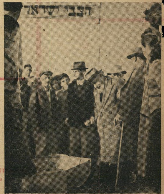
החורים השכולים בטקס הנחת אבן פינה למצבת זכרון לבניהם שנפלו בצובא.