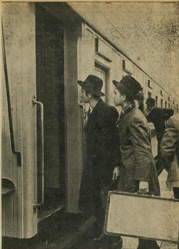
"בל הקרונות מובילים לירושלים..."