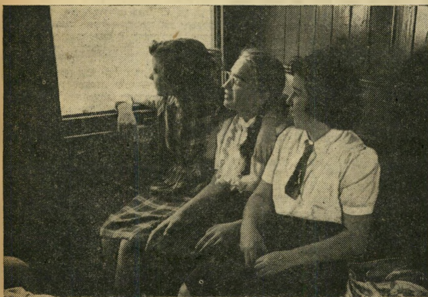
שלוש שיצאו לדרך...