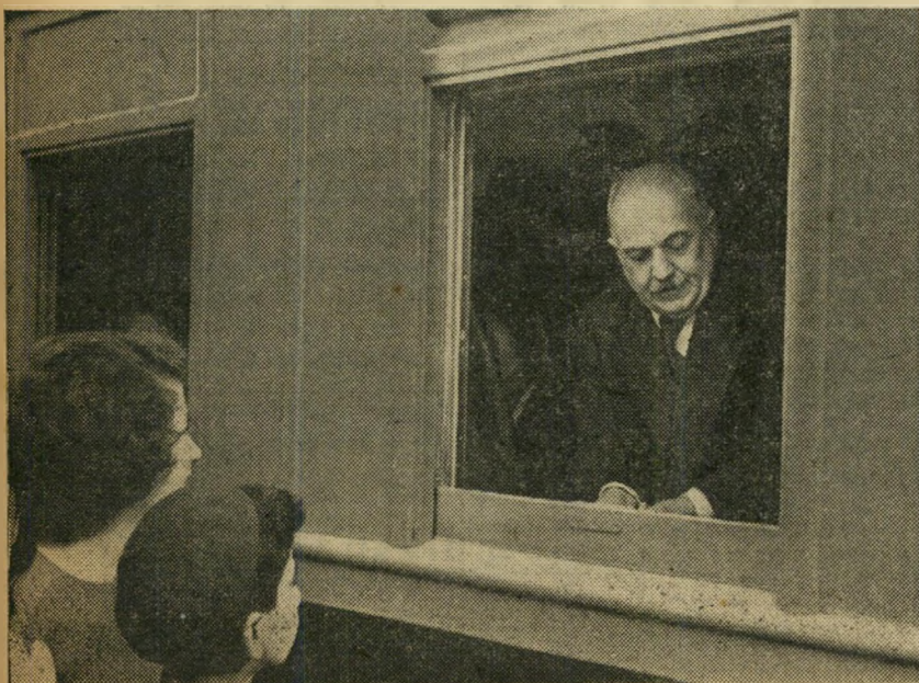
שר התחבורה בכבודו ובעצמו.