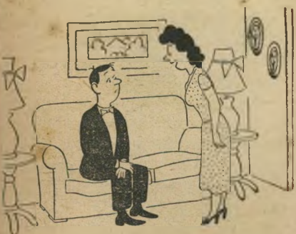
„הייתי מציעה לך מן הסוכריות שהבאת לי, אולם אנו שומרים עליהן בשביל האורחים“.