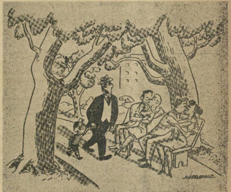
„חץ מהכלבים, הנשים הן הידירות הגדולות ביותר של האנשים“.