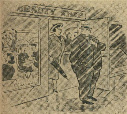
„אידיוט, למה לא חכית לי בפנים“.