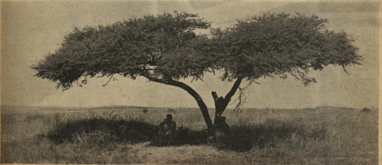
עץ מצד כננו. רק מי שנתנסה בשרב המדבר ובשמש המכה בדהט עי ראש, יודע להעריך חשיבותו של עץ כזה.