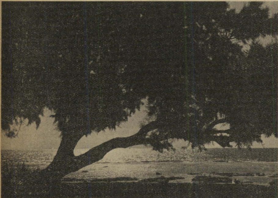
צדיעץ בשקיעת חמה ליד עכו