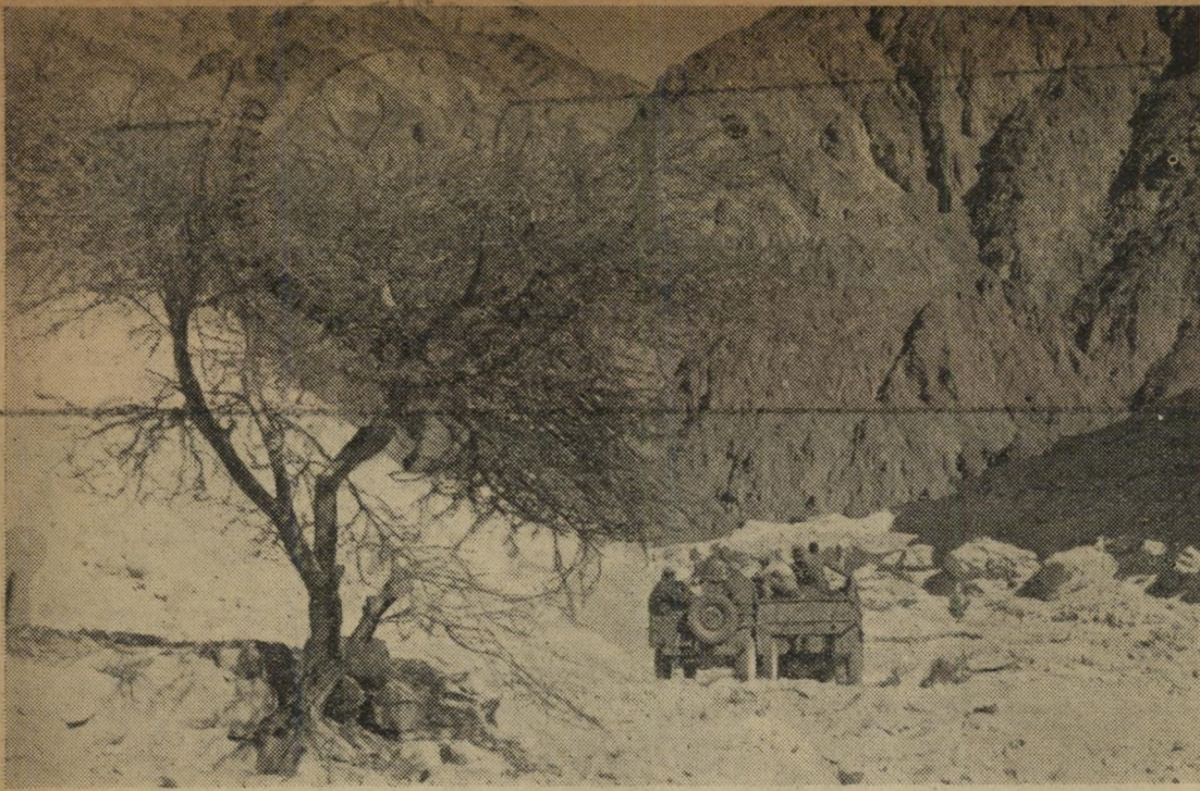
בין הרים בדרך לאילת.

אנו, שרובנו שקועים בחיי-כרך סואנים, בעסקי יום יום ובהווי חולין של דאגה לפנסה, מתעלמים כמעט לחלוטין מיפי ארצנו. חיינו מתרכזים כאילו בעולם של ממצ אחד — בין "קופסאות-הבתים" של החובות מגובבים זה על גבי זה. על כן איף לבנו פתוח להנאת יפי ארצנו, ואין אנו יודעים על המינים המופלאים של העצים בכל רחבי המדינה. עצים עתיקים הנושאים "עומס" היסטורי של מאות בשנים, ועצים חדשים, המעידים על מפעלה-החיים המתחדשים במולדת הישנה. בימים אלה שלחנו את צלמינו מרן ועד אילת והם הביאו לנו אוסף נהדר של עצים. כל עץ ופרשה משלו, כל עץ וסיפור-חיו שלו.