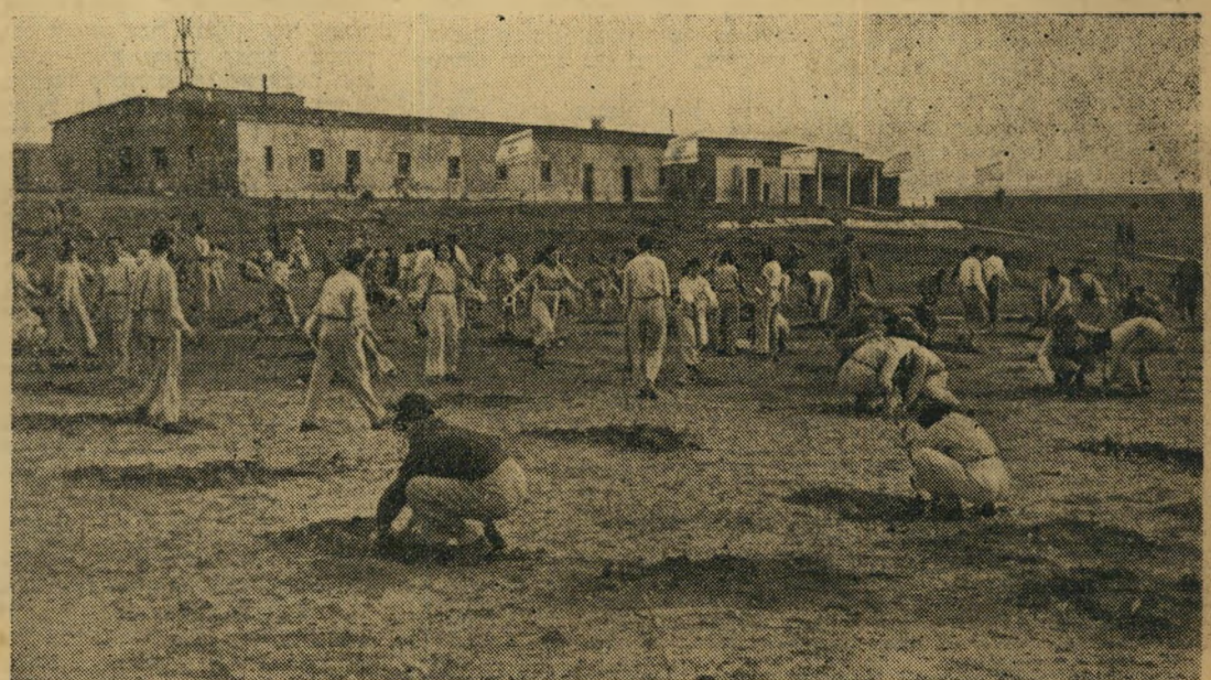
הנטיעות במ"ו בשבט בעצם תוקמן. ראש השנה לאיכות הקדים את השלג והכפור.