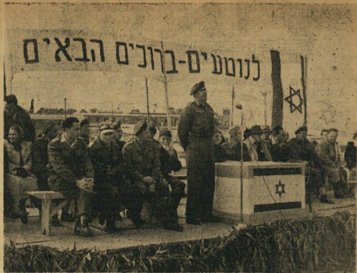
"מבצע נמט" במחנה צבאי "אישם"

הנוק הכלכלי הנגרם למדינה על-ידי הימנעות זו ברור גם לשרי-האוצר, (המשך בעמוד 15)