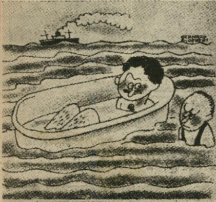
הרופא ציחה עלי לקחת "אמבטיותיים", אך איני אהב במיוחד מים מלוחים.