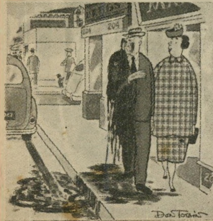
הנה, זוהי הסיבה שהג'נרלמן נוהג לצעוד תמיד בקצו המדרכה.