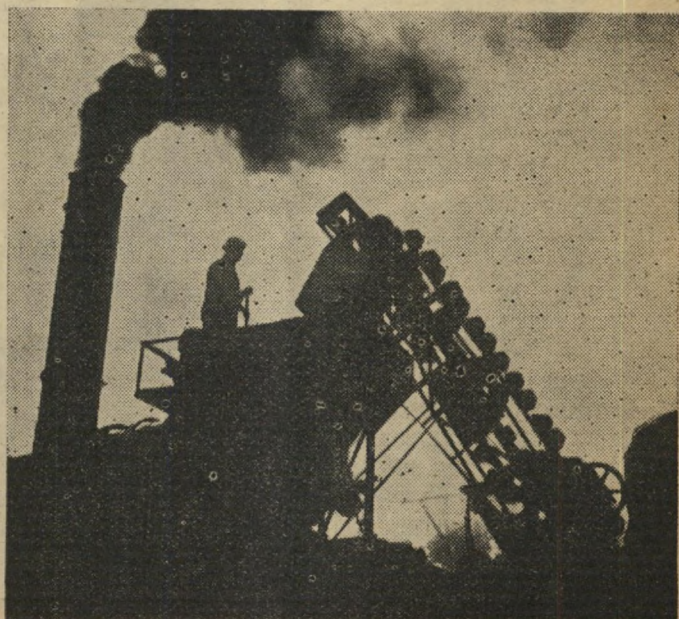
למוד רקע השמים...