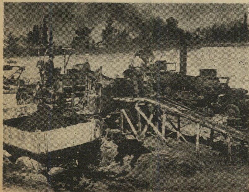
צירום כלדי של המפעל.