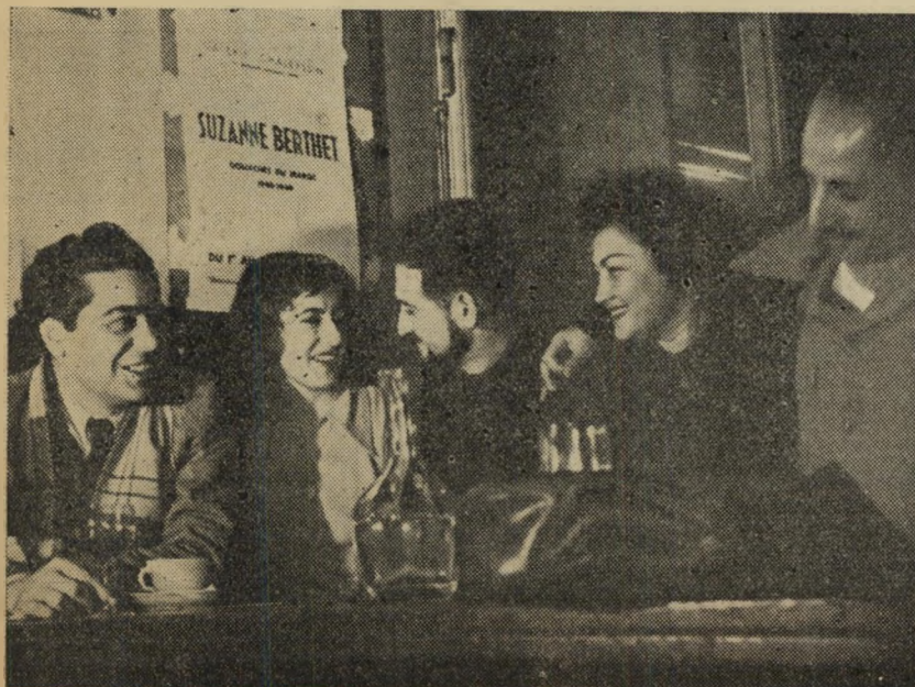
"פינה ישראלית" על כוס משקה בקפה "רום" המפורסם.