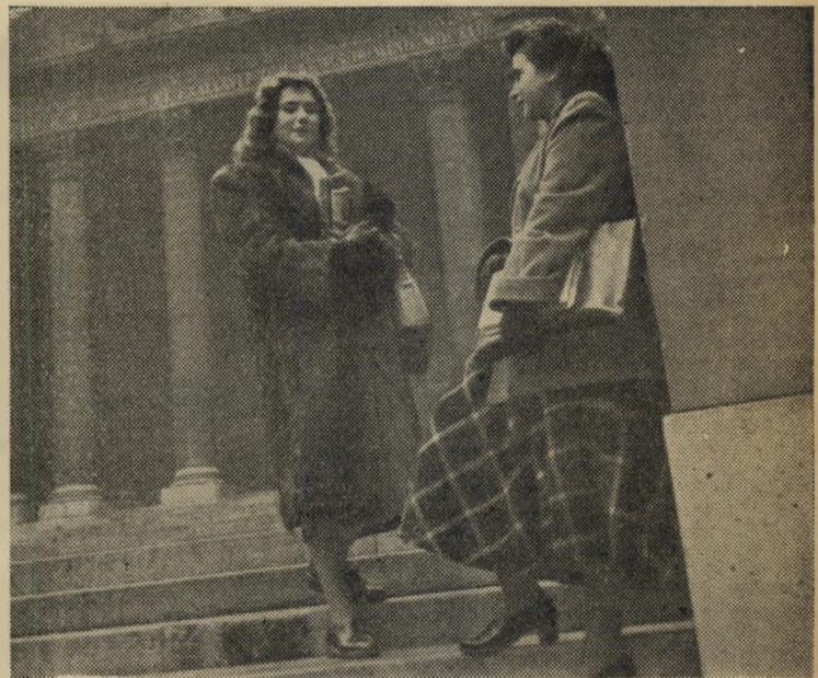
על רקע הסורבון. סטודנטיות ישראליות לאמנות, שתייהן חיילות משוחררות.