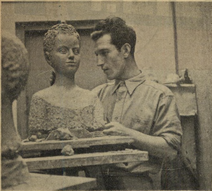
שמאי האבר הוא פסל נדמה כי כל עולמו מושקע בפרי-עבודתו.

נראה שהאמנות אינה מותנית לא ב"צ" נע" ולא ב"דיכויים". גם היום עוד יש "מושבות" ישראליות בבירות העולם, והפעם הננו קורעים בשביל קוראינו אשנב לעולם-האמנות בפריז. לכאורה חוזר הכל לקדמותו: אותה אוירת משקה, יצירה והילולת-אמן. אך הוד העבר הועם, בכל זאת. היום שוב לא נמצא מספר כה גדול של אמנים וסטודנטים לאמנות כאשר היה לפני המלחמה. נשתנו הזמנים ונשתנו התנאים. ואולי, מוטב כך. כלום לא הגיעה העת שאמנינו יפרו את דמיונם וייצרו את פרי-מחשבתם במולדת? עד מתי נחזור אחר אכסניות בגלות?