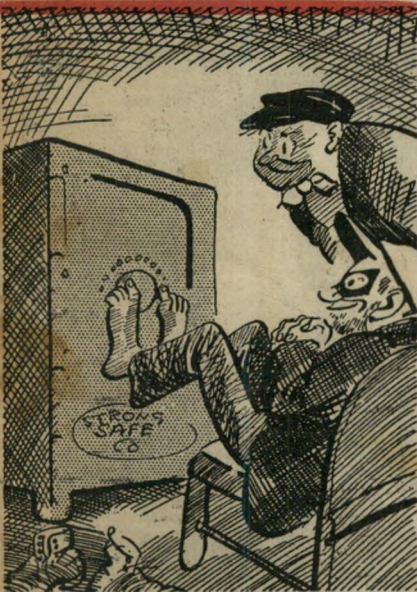
"כך לא נשאר שום טביעת אצבעות."

"חיות הנגב" זוג אמריקאים שבאו לתיור בארץ עם ילדם בן השש החליטו לבקר בהצ"ר גת "חיות הנגב באות העיריה". ההצגה מצאה חן בעיניהם אך הרגישו שאין התוכן כשם ההצגה, אלא שאיש לא העיז להעיר דבר בנוגע לזה. אחרי גמר ההצגה פנה הילד אל הוריו ואמר: — "מזורה היא ארץ-ישראל מאד." — "מדוע?" תמהו הוריו. — הלא ראינו, ענה הילד, "כאן החיות הן על שתיים ואילו אצלנו הן על ארבע." עקיבא הרשקוביץ, חיפה