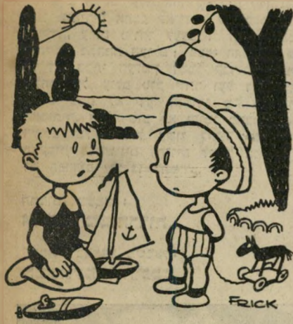
בן כמה אני? — בבית בן 5, באוטו — 3.

שעות נוספות אדם בא להרשם בלשכת העבודה. — כמה שנים עבדת במקום הקר- דב? שאלו המזכיר. — 35 שנה. — ובן כמה אתה? — בן 32. — איך זה אפשרי? — עבדתי שעות נוספות... אליהו כהן, ירושלים