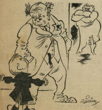
— אבא, מה זה "סמכות מלאה"? — שאל את אמך!