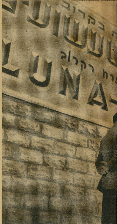
צילומי-סיור ע"י בנו רותנברג