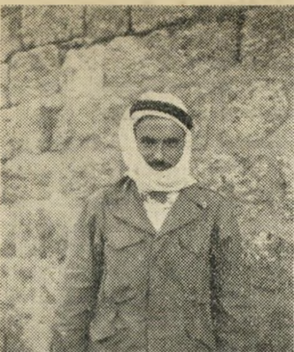
מוכתר הכפר או מזרעה כמו המודי, שיהיה בקרוב נציג הכפר במועצה האזורית.

את הכסף הזה בחזרה מהבנק, שפתח את סניפו בעיר עכו מחדש, ולקבל הוספה מן הממשלה לביצוע התכנית. זהו הדבר שדרוש לנו בראש וראשונה — אומר המוכתר — כי דור חדש, נוצר שהתחנך לפי רוח המדינה, וכולו להפוך את הכפר לכפר ערבי לתפארת במדינת ישראל. הקונים כבר לא יצליחו בזה, הם לא יבינו אף פעם למה לנו הקדימה.