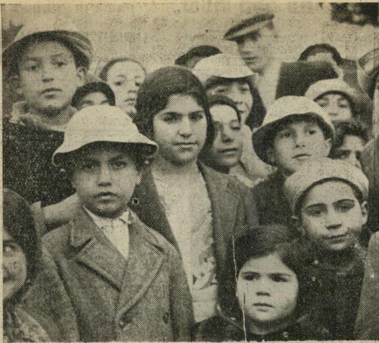
ימים ראשונים במחנה המיון על שם הנס בויט ז"ל על הר הכרמל.