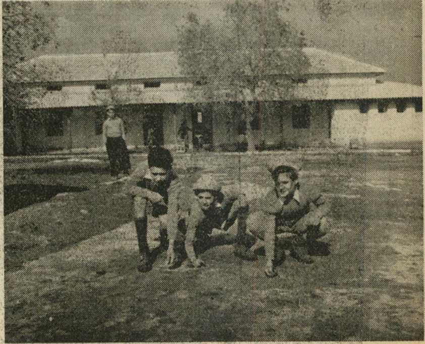
למטה מימין : המשחק, בחופש, ללא פחד מחזור לנערים את ילדותם.