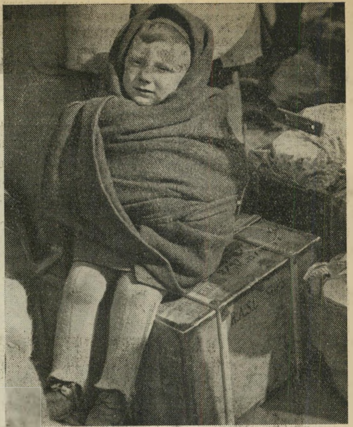
אחד מארבעים האהב שהגיעו.