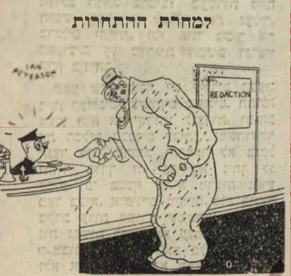
«אני רוצה לדבר עם הרפורטר שכתב היום בעתון את המאמר על התחרות ההתגוששות שלי».