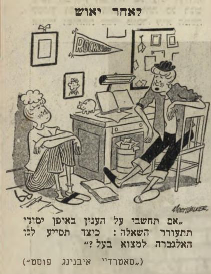
«אם תחשבי על הענין באופן יסודי תתעורר השאלה: כיצד תסייע לנו האלגברה למצוא בעל?» («סטרדיי איבנינג פוסט»)

הרעמים מזל הקטנה שואלת את אבא: הרעמים מעיפים פצצות? — לא, עונה האבא, הם רק מביאים את הגשם. אומר שמעון הקטן: אבל בזמן המלחמה הרעמים יכולים להבהיל את האנשים. דינה סויד, רמת-גן