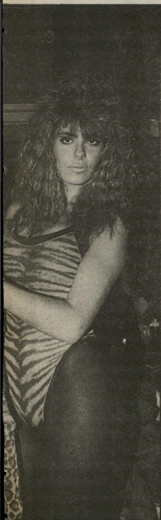
מקומית סלביאן דנו החטובה במיקטורן העור של בכובע בוקרים מקושט. ליאור ואחיו

כאלם נראו עשרות אמנים, אנשי-תיקשורת ופר-זיפים לא מוזהים, שבמהלך הערב נתגלו כחברים של