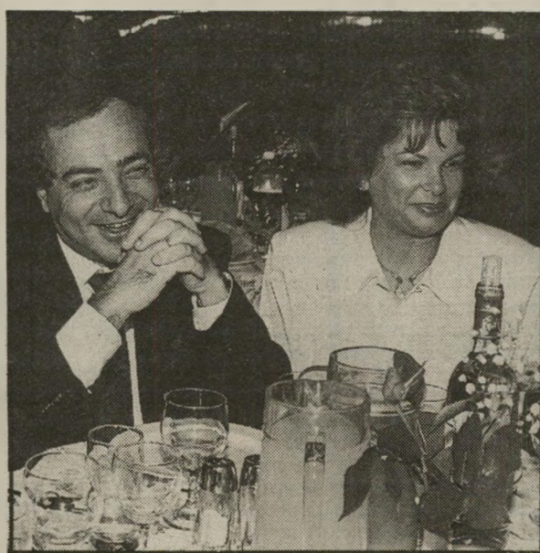
לארץ. בני משפחת גינדי שבו ארצה, מסתבר, בעיקבות הסדר שהגיעו אליו עם שילטונות-המס. הם שומרים על פרופיל נמוך ואינם נראים באירועי-צדקה שונים, המשופעים בני-מעמדם.