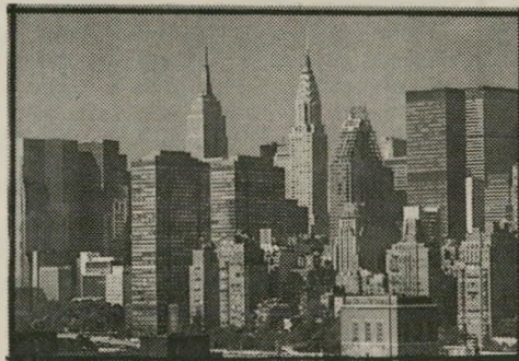
קפה אצל וניירו קייטרינג להלוויות

ניו יורק משופעת בתייקפה. לא אגזים אם אומר שכמה מאות בתייקפה פזורים ברחבי העיר הזאת. הפעם אני לוקח אתכם איתי לביקור קצר בשני מקומות