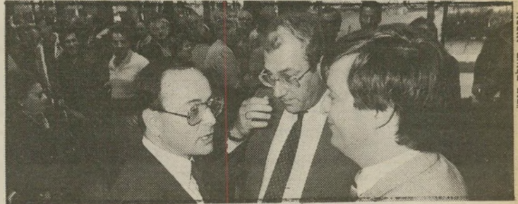
נסיכים: מרידור, אולמרט ומילוא כולם רוצים את אותו הרבר — ראשות הממשלה

למשלה עם וירשובסקי ומפ"ם. אם אכן יקרה הבלתיאמיני, הרי שמייבנה רופא זה יתפרק תוך תקופה קצרה. בבחירות שיבואו לאחר מכן יכו מצביעי הימין בש"ס וימחקו את אגו"י מהמפה. הטריק של השבעת הרבנים עובר רק פעם אחת. הרבי מלובניץ'