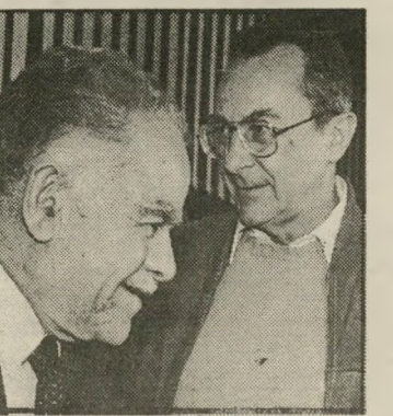
שמיר-ארנס: מאזן-אימה פוליטי

הצפויים בין אלה המתמיימים לרשת את המנהיגות הנוכחית בליכוד. גורמים מסויימים במחנה שמיר-ארנס, מטעמים שונים, דוחקים להכרעה במרכז בנושא מדיני, מתוך הכרה כי זהו חלק מהמאבק העתידי על מנהיגות התנועה, עם הליכתו של שמיר. מכל מקום, על השחי קנים במישחק המסוכן הזה לדעת כי גם כנאו היום, כאשר יסיים שמיר את תפקידו ותיפתח ההתמודדות, כל ניסיון של אחד המחנות ללכת על כל הקופה ולחסל את היריב, עשוי להביא לפיצוץ ולפילוג, וכתור