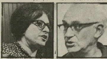
אישים בעלי שיעור קומה בינלאומי כמו ברטראנד ראסל נרתמו למסע הכוזב הסובייטי "BETTER RED THAN DEAD" — היתה סיסמתם. כמוכן — שאין סיכוי כלל לנצח את הקומוניזם של הקרמלין בגלל הבשרוה עצמה לעמלים ובגלל עוצמתה הנוראה של ברירה"מ. לכן צריך להצטרף ל"בוחות המחור". ומייד. אין זמן.

"יונת השלום" שאימצו תועמלני הבלוף של הקרמלין, מפרי מכולו הגאוני של פאב"ל פיקאסו, ו"חפה מעל" עצרת השלום של מיליונים שבניה"מ אירגנה ממוסקוזה ועד קובה. אישי ציבור, פרלמנטרים מכל המדינות נרתמו למכונת הדיסאינפורמציה הזאת. רבים מהם תוך תמימות, נאיביות, או פשוט — חוסר שכל פוליטי אלמנטרי. אבל תמיד היו שם גם המאניפולטורים הפוליטיים, שסייעו למעצמת הטרור מתוך הישוסים פוליטיים-אישיים קרים וציניים.