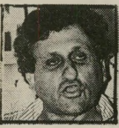
א.ב. יהושע בהמתנה לאקטווס