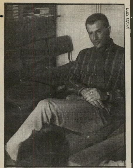
פסיכולוג־רפואי זומר האשה, לא המזכירה

א ישיותו של ארס, המועד לחלות כסרטן, היא כזו המדחיקה ברר־כלל את רגשותיה, והמתקשה להביא אותם לידי ביטוי מילולי. מחקרים אחרונים שנעשו על חולי־סרטן בארצות־הברית הצביעו על אנ' שים שיש להם גישה פסיכית, פסימית ותבוס' תנית בחיים. אצל חולי־לב זה להפך.