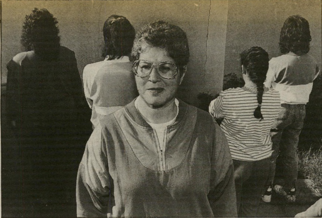
יוזמת רוניק ומועמדות לאיגוד המיקצועי הסכמים קיבוציים

א ין ספק שזוהי פריצת-דרך עבור ציבור גדול של נשים. הבעיות הנובעות מה-