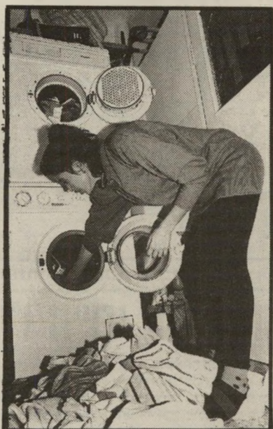
9.00 סוף-סוף נגמר הוויכוחים בין הילדים. אני לבד. ממה להתחיל קודם? ערימות הכביסה לעולם לא נגמרות.