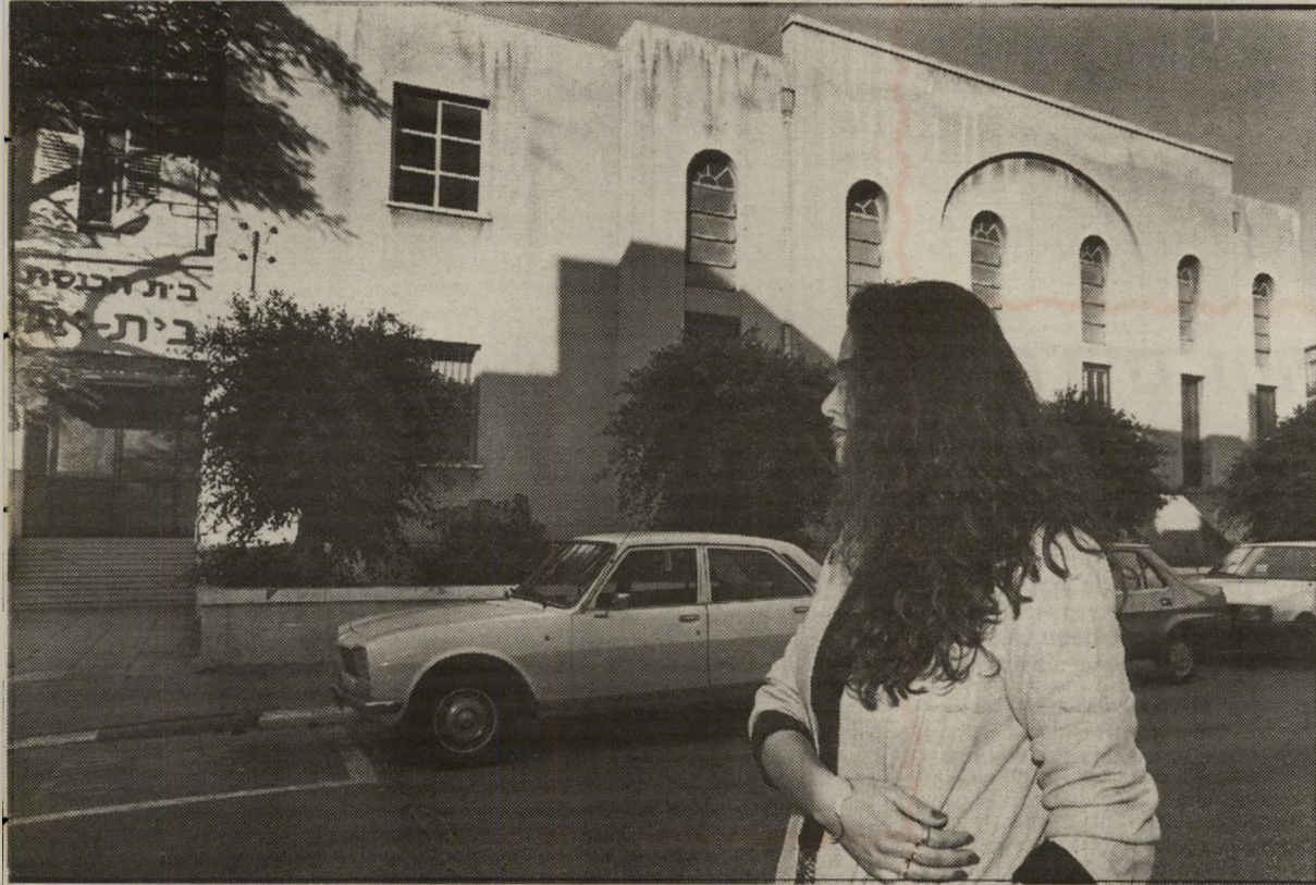
בית-הכנסת ברחוב פרישמן 27, הרב אמר לי לבוא לשבת לידו.

חיים קשת , גימלאי נמרץ, רצה לעזור לרוזה בגיורה ועקב אחרי ההליכים. כאשר שמע מהבעל על הפגישה המזוהה,