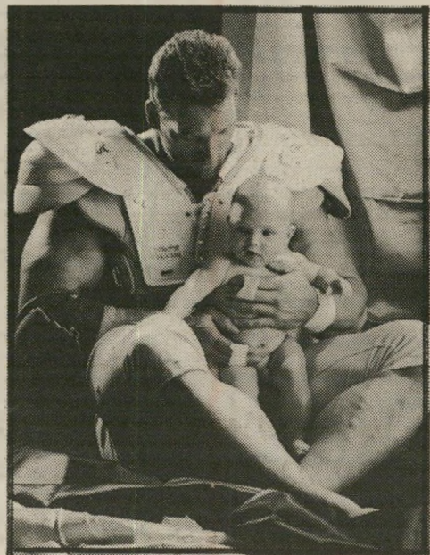
גלויות גבר ותינוק

בתקופה האחרונה אנו גם עדים לתופעה נוספת, שלרעתי התחילה באמסטרדם, וכיום היא כבר נפוצה בכל עיר