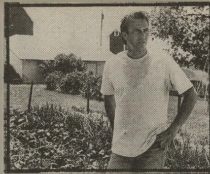
קווין קוסטנר: רוחו של האב

*** סכס, שקרים וזידי-אריטיים (צפון, ארצות-הברית, מוצג גם בחיפה ובירושלים) — תרגיל מבריק בשיחות מלוכלכות בין פרקליט מיוחס, אשתו הצנונת, גיטתו המתירנית וידידו האימפר-טנט, שמראיין נשים על חוויותיהן המיניות. הבימאי סטיבן סורברג