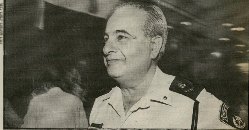
ראשי יח"פ כספי הסונדר הונך יח"פ

כמעט חודשיים עברו, ובאופק לא רואים כתבי-אישום. איך פועלת היחידה לחקירת פשעים. כמה עובדות מפתיעות א"ל ארליך