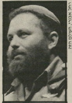
יחול אבנרי, העולם הזה

זה נובע מכך שחטיבת גיבנתי מילאה תפקיד חשוב מאוד בחיי הייתי חבר בה מיום הקמתה. כמה מן החוויות הגדולות ביותר של חיי הוותיה כשורר תיה. ניסיתי לתאר את רוחה בספר בשדות פלשוח 1948, שמפקדה החטיבה — גיבנתי האגדתי עצמו — כתב לו הקי רמה. כתבתי את הימנון הסיי רת שלח, שנועל שימשון. בתום מילחמת יוסי'הכרי פורים, כשצה"ל הבחין פתאום שמרוב הדיקות אחרי הטנקים השועטים (הטנקים תמיד "שו" עטים") הוא נשאר כמעט בלי חיל'רגלים, הקימו את גיבנתי מחדש.