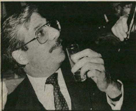
מנהל מסר מוכן ללכת למכונת'אמת

עבור כמה ימים עדיין לא נרגע אלי מסר. בעזרת הפירסומאי יורם ברנע, משורר לעת'מצוא, הוא כתב