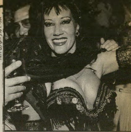
סוהיר מפיצים שהיא גבר לשעבר

ומה עם השמועות? אני יודעת מי מפיץ אותן, רקנית-בטן וחברתה היחצנית. הן החתילו בסיפור הזה, והן מפיצות אותו הלאה.