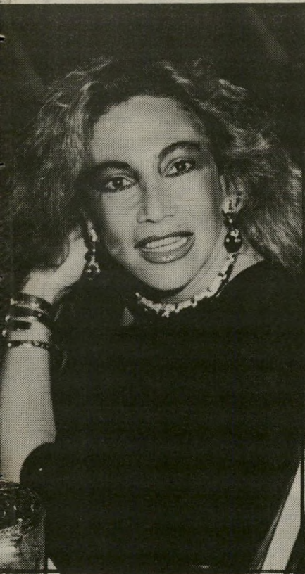
מיכל בקר בעיות של רכוש

השפיונים שלי, שלפעמים מדהימים אפ"י לו אותי, גילו לי שהגברת בקר ביקרה לפני