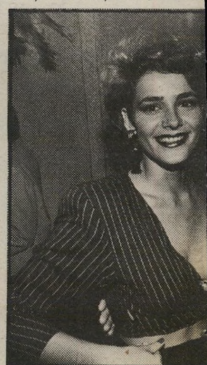
אלר מציגה לראווה חזה מפואר. יל בכל הקשור לצילומים וחיי־ וד כדוגמנית־מסלול בתצוגות.