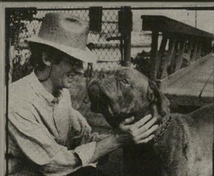
בימאי ספוטשוודי וכלב הוף': מי נובח

אין טעם לפרט את העלילה, שכן אין שם הרבה פרטים שיש בהם איהה שהלא הגיון. אבל רק נצוין שהעניין הוא בשוטר חוקר, כפי שמגיד דיד את עצמו הנקס ורוד-הלחיים ותכול-העיניים, המשתעמם נוראות מחוסר-הפשע בעיר-