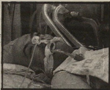
אחרי ניתוח, על־חושמו

מי הדליף? מייד עם היוודע הפרטים, החל בישראל ייבוח על ההרלפה. מי הדליף את הידיעה? האם היתה זאת מעילה באמוץ? אם כן, מי אשם? האם פעלו רופאים או עסקנים של בית־חולים לשם השגת פירוטת וזלה למוסר שלהם? הוויכוח כולו מוזר במיקצת. אין מעשה נאצל יותר מאשר החלטתם של בני־מישפחה