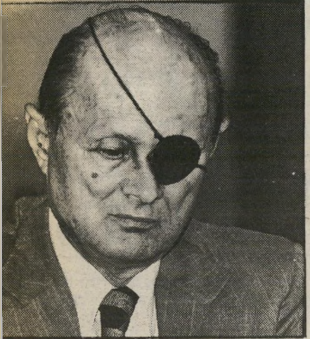
דיין לא היה מודאג

כמאי 1973 ערכו הערבים הכנות למיל"כמה, שגרמו לגיוס בישראל. אחרי-כך התברר שזה היה תרגיל. כאשר ערכו הערבים שוב הכנות כאלה בראשית אוקטובר, זה נראה כמו תרגיל נוסף, שמטרתו האמיתית היא להתיש