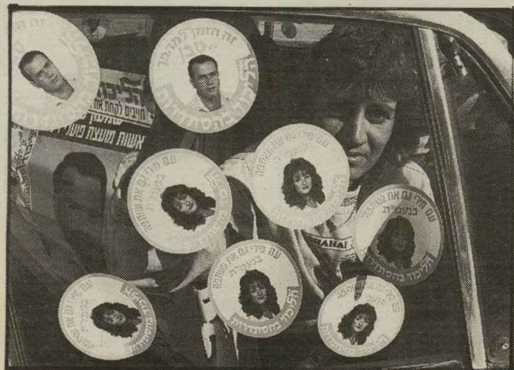
פעילה של הליכוד מזבילה בוחריים , ותיקי מפא״י היו נאים בשיטות הליכוד“