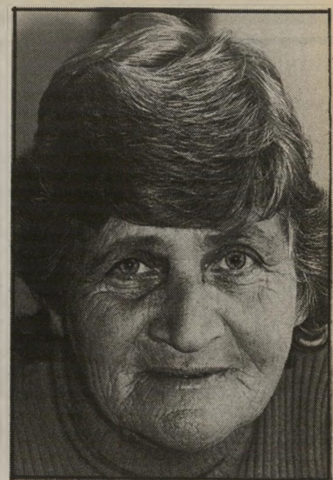
איון מריה העולם הזה

בגלל הסיבות שהזכרתי קודם, אני משער שתהליכי-האי-חוד, אם בכלל, יהיו איטיים מאוד, ולבסוף יובילו לאיזה איחוד רופס. אבל קיימת גם אפשרות שמדינות אירופה המיזרחיות, וביניהן ברית-המועצות, יצטרפו ל„בית האירופי“ (מונח גור-באצ'ובי), ואז תוכלנה שתי הגרמניות להיות חברות באותה ברית אירופית גדולה. (דניאלה שמי)