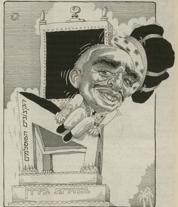
כסאות המלך החדשים