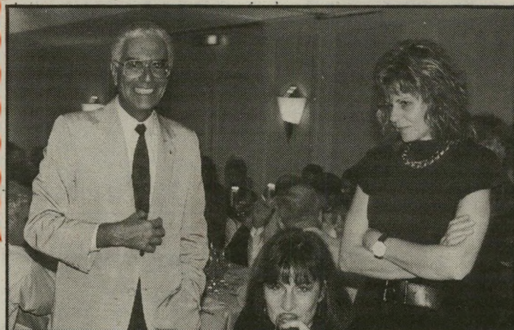
אל ידעו העולם הזה

יתכן שבעוד כמה פגישות הם יגלו שיש להם הרבה יותר במשותף מכפי שהיה להם בעבר, או שאולי לכל אחד מהם יש אהבה. כשאדע ארווח לכם.