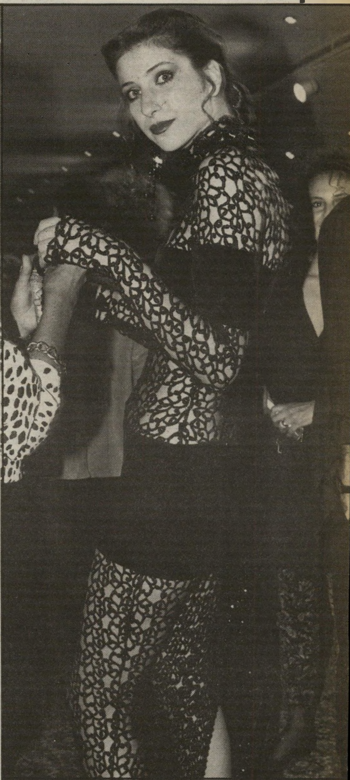
נערה מרושתת אחת מהמתמודדות בתחרות ה"יחודי. לדעת רבים ניחנה בכל הדרוש לדוגמנית-מסלול טובה.