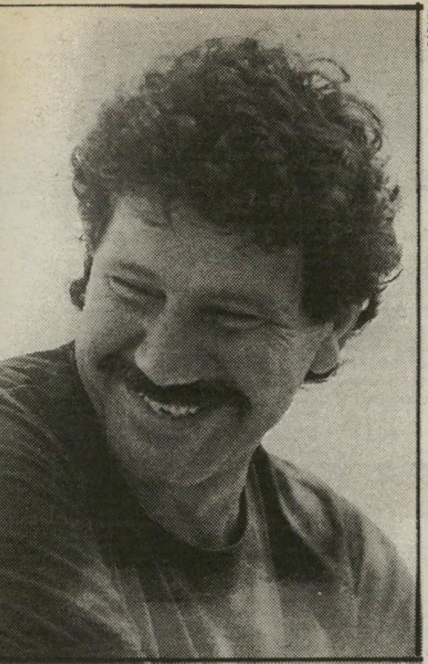
רביחובל צבי לפתוח באש

טראומה קשה. כל יום נגענו בין תיקוה ליואש. הרגשנו חסרי-אונים. לא היה לנו מושג אם מטפלים בעניין. היה לנו קשה מאוד. "קשה מאוד" היא אמירה החוזרת אצל כל הנוגעים בפרשה. אם אכן זוהו המים על-ידי המיכלית, אם לאו, יברקו האחרים לכך. נקודה חשובה היא שפעמים רבות-מדי נתי-קלים באי-נעימויות הקשורות למצריים. יתכן ולישראלים קשה מאוד, למרות שעברו כבר 12 שנים, להביז כי אנתנו לא יכולים להנך את המצרים להתנהג אלינו כפי שהיינו רוצים. הגיע הזמן שישראלים יבינו כי למצרים חוקים משלהם. חתמנו עם מצריים על הסכם-שלום אמיתי, ולכן עלינו לכבד, גם אם הרב כרוך במאמץ, ולמלא אחרי חוקי המדינה כנדרש.