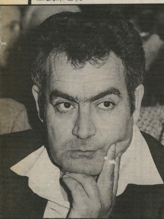
נציג נחמיאס שליחות-ספורט ליונסקו

הקבוצות, מוסר לי מילצ'ו את הנתונים הכספיים, מרוויחות מהכרטיסים, מהספונסרים המפרסמים, ומהטוטו. בסך-הכל, בממדי צע כמונו, כי זה תלוי במיקום הקבוצה ובי תוצאות-המישחקים, כל אחת מקבלת מהטוטו כ-400 אלף שקלים לעונה. ● וכמה אתם מקבלים? אנתנו? אתה שואל עלינו? כמה אנתנו מקבלים? ● כן. אנתנו מקבלים 10 אחוזים מההכנסות של כל הקבוצות. אבל יש לנו הרבה הוצאות. פעילות, מנגנון, אתה יודע. אני יודע.