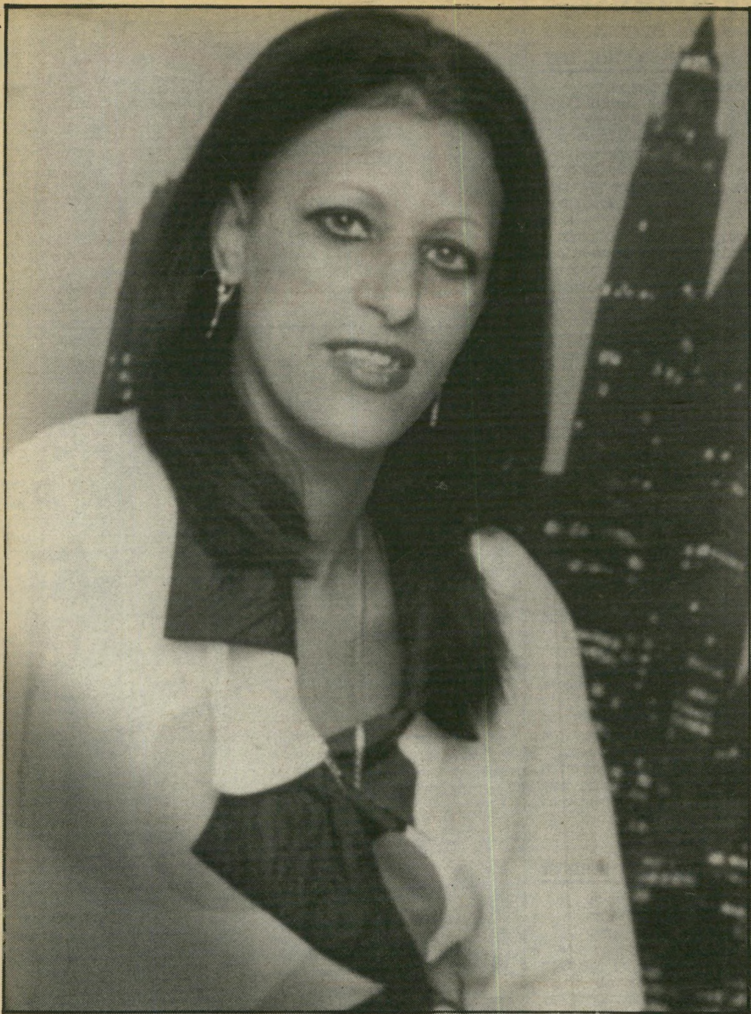
לא בוכים על שרמוטה. המישפחה שלה החרימה אותה מזמן. עכשיו היא נרצחה. סוף עצוב לילדה בלי אבא. (עמוד 32)