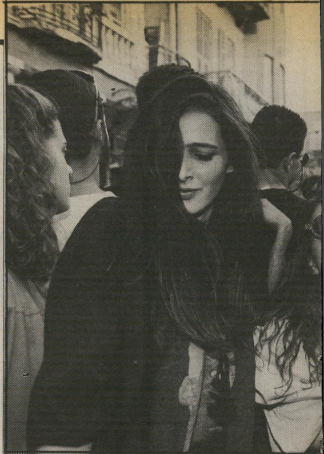
הריקוד התרוממה חולצתה אלי'על וחשפה את החזיה שלה. ארי עבר לפני כשנה תאונת-דרכים קשה. כולם היו בטוחים שהוא יתקשה ללכת ולתפקד, אך במהלך החודשים שעברו הוא גילה כושר-החלמה נדיר.