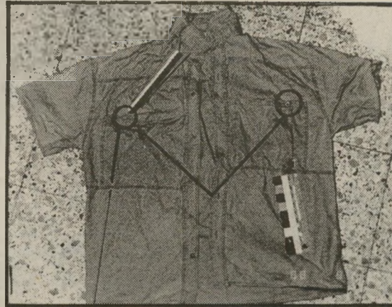
חולצת הנאשם שבה חסר כפתור