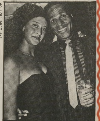
וין קרדינל וגיתו חזן מוכן להתניס ללהקה צבאית

השבוע חגג הזמר הטרינידאדי וין קרדינל את יום-הולדתו ה-47. אני באמת לא יודעת כמה, כי הוא לא מגלה, והחברים שלו בארץ לא זוכרים את ימי-נעוריהם בשכונה או