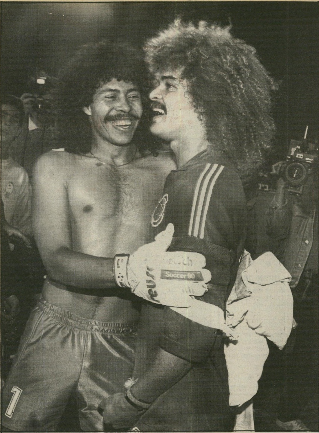
מאניה דפרסיה ישעיהו ליבוביץ' על מישחק-הכדורגל (עמוד 10)