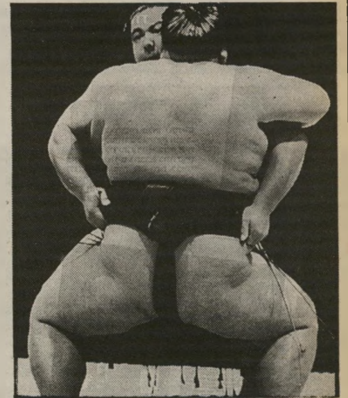
לוחמי הסומו בפעולה

ואו, על בימת־חירם קטנה ועגולה, עומד חזירייבלות אחד כפווה מאימת מול היפופוטם אחר, גם הוא כפווה מאימת, ואחרי כמה שניות, כשהם עומדים גוש־שומנים מול גוש־שומנים, הם מתנפלים זה על זה ומתחילים להרוץ, כשהמטרה היא להפיל מישהו לחימר, או להרוץ אותו מחוץ ליורה