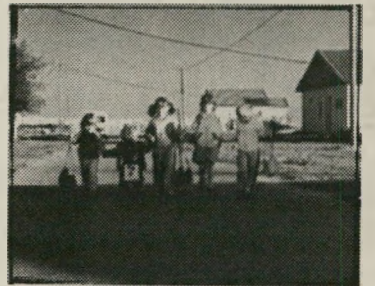
התוצר המסואר של הגוש חוף של יד' קטן לא ברא אף עסקן

אין כן יהודים אחרים, כאילו נחנתו על פני הירח. בתליאביב בירושלים במקומות שונים בארץ, אתה פוגש את הישראלי המצוי, — צריך להחזיר, "צריך לוותר" האמרי' קאים לא יתנו" — ושאר קריאות ייאוש. שלא תהיה טעות. יש כמובן למרבית המי' זל, גם יהודים אחרים בירושלים ובתליאביב