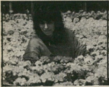
חממת צמחי נוי

לכן התקשורת, ובראשה הטלוויזיה הישר' אלית, ישרו ויצלמו ללא הרף את הפורעים הפלשתינאים ברצועת עזה. את "מחנות הפ' ליטים" ואת ההתנגשויות עם חיילי צה"ל.