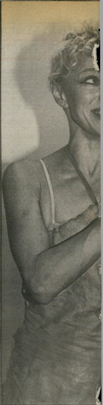
לא הופיעה בארץ זה 10 שנים וזאת ה הראשונה מאז. לפני הופעתה הקריא א נגמר וקצת הצחיק את הקהל.

שבוע ההצדעה לסרט הישראלי, שנערך בסינמטק בתל-אביב, היה אפוף מיפגשים מרגשים בין שחקי-נים, בימאים ואנשי-קולנוע שלא התראו זה שנים. חלקם פרשו מהע-נף, אחרים מתגוררים בחו"ל. האי-רוע המרגש ביותר היה הקרנת סרטו הראשון של המפיק למנחה גולן, שבא במיוחד מחו"ל להקרנה של הסרט העלילתי שלו, שבמבט לאחור נראה כמו מיסמך תיעודי של חיי הלילה של העיר העברית