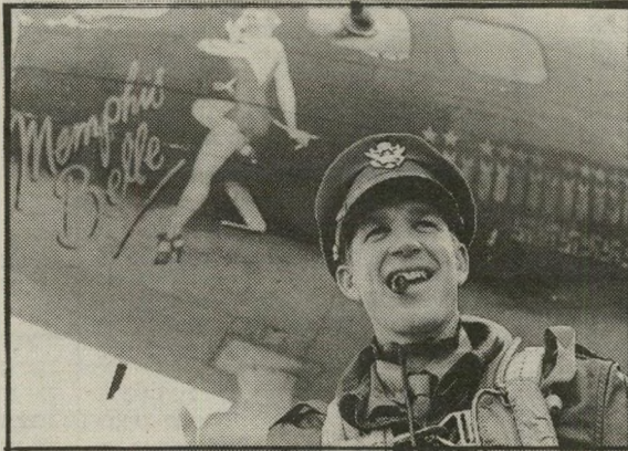
שחקן מודין כפרט, 'יהפית ממס' המיצר המעופף של מלחמת העולם השנייה

פיה והילפן, קפה בנדר, מי הפליל את רוני רביט? חיפה: סכס, שקרים ווידאר מי.פ. ירושלים: בנל המלחמה ה היא, סכס, שקרים ווידאר.פ. קפה בנדר, חלף עם הרוח, הלזא פופין, מי הפליל את רוני רביט תלאביב