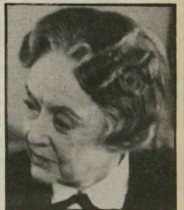
שחקנית דיוויס עיניים כחולות וגדולות

נפטרה ♦ בפאריס, ממחלת הסרטן, ב"גיל 81, רות אליזבת (בטי) דיוויס, שחקנית הקולנוע האמריקאית הוותיקה (ה)